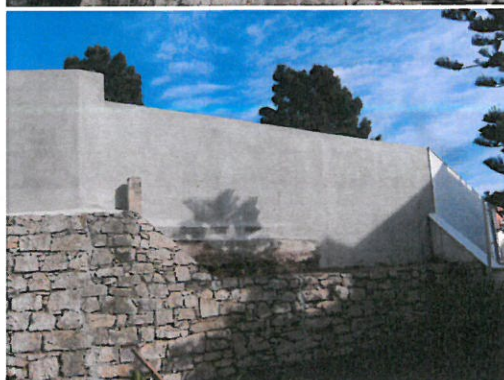
Fotos do estado atual dos muros de vedação/suporte