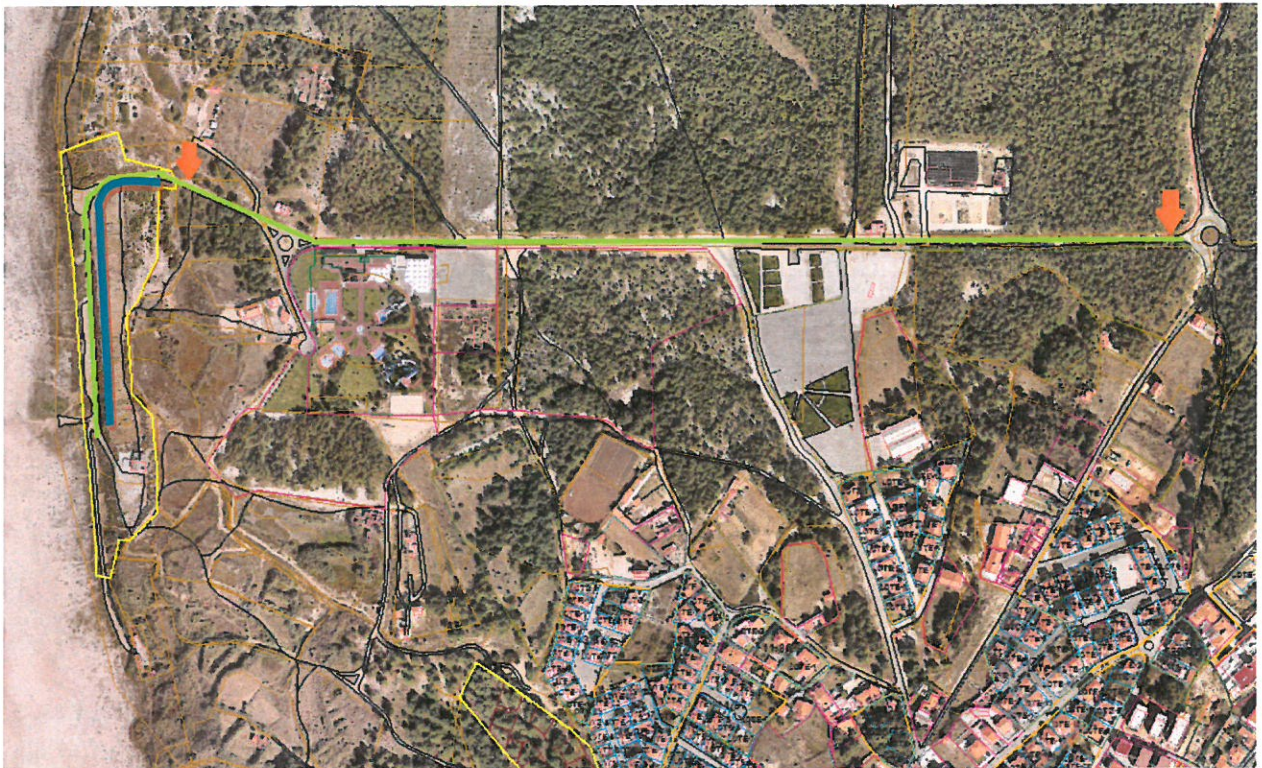
Planta 1: Localização das duas placas toponímicas (Laranja) e do arruamento com a Designação Rua da Praia do Norte (Verde). Troço a que se pretende estender a designação toponímica de Rua da Praia do Norte (Azul).