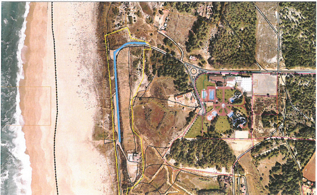
Planta 3: Troço a prolongar com a designação de Rua da Praia do Norte.