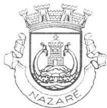
MUNICÍPIO DA NAZARÉ Câmara Municipal