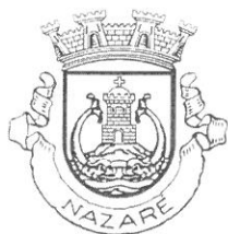
MUNICÍPIO DA NAZARÉ Câmara Municipal