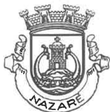
MUNICÍPIO DA NAZARÉ Câmara Municipal