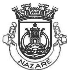
MUNICÍPIO DA NAZARÉ Câmara Municipal