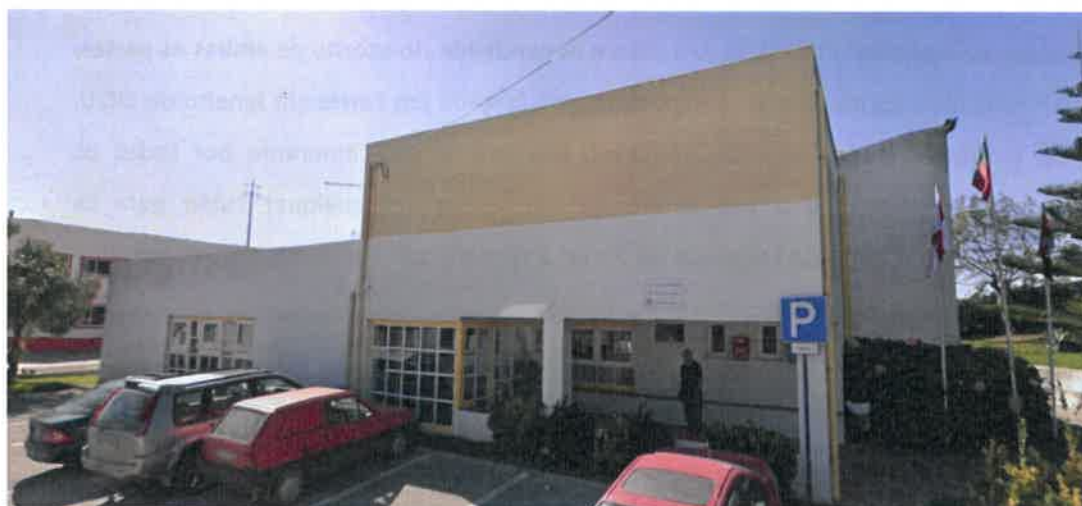
Figura 2 – Edifício Atual