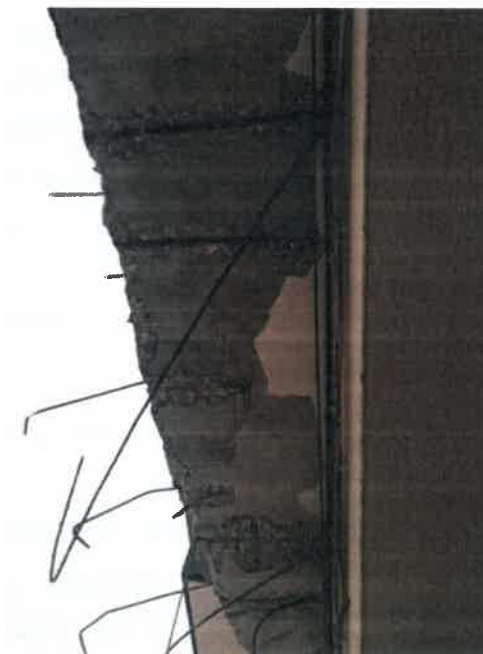
Foto n.º 2 - Vista exterior sob a varanda